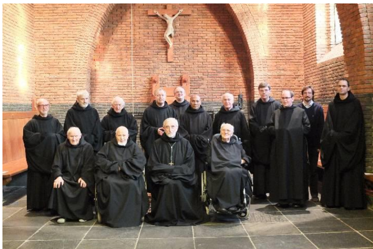
De bewoners van de St. Adelbertabdij

Eind september vertoefde ik samen met mijn echtgenote voor een korte vakantie in Egmond aan Zee. Mooi weer, mooie zee en veel wind. Naast lezen en wandelen bekeken we ook een beetje de omgeving. Tijdens deze rondgang bezochten we de St. Adelbertabdij in Egmond-Binnen. Deze benedictijnenabdij kent een lange geschiedenis die teruggaat tot de 10 e eeuw. Nu wonen er nog ongeveer twintig monniken en monniken-in-opleiding, variërend in leeftijd van