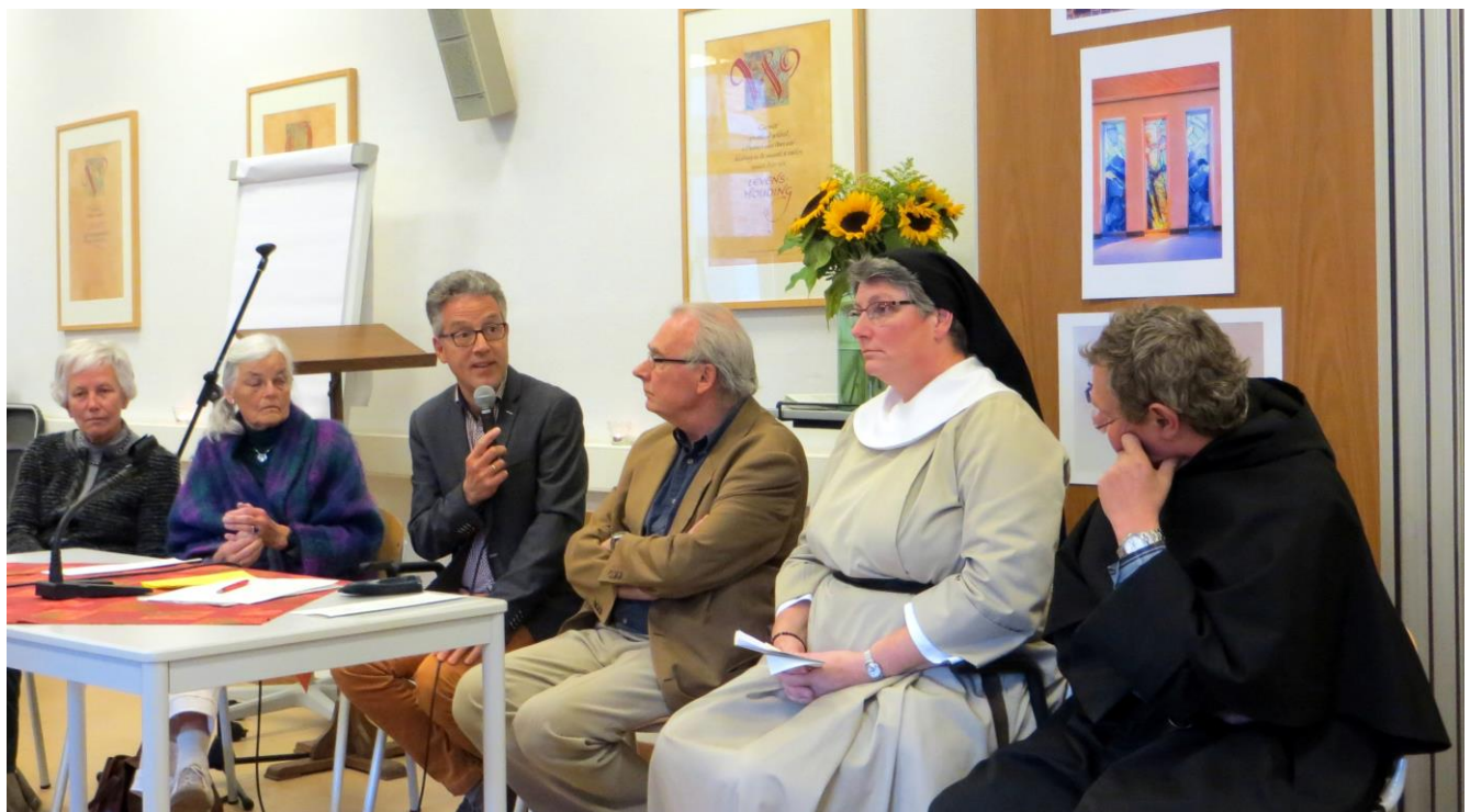
Het ronde tafel gesprek

Aan het eind van de dag vond een ronde tafel gesprek plaats met alle sprekers. Na een lange dag waarin de toehoorders veel informatie kregen te verstouwen, bleek hier niet veel animo meer voor te bestaan. Na een korte gebedsdienst werd de dag met persoonlijke ontmoetingen en een glas in de hand besloten. Deelnemers, organisatoren en vrijwilligers kunnen terugkijken op een zeer geslaagde dag.