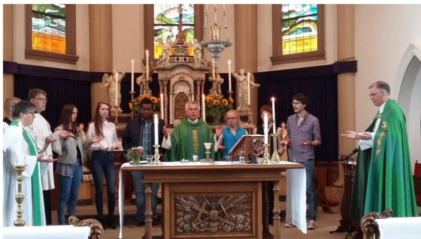
Het Onze Vader