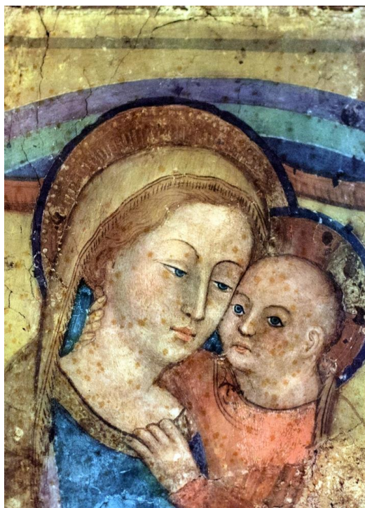
Maria van Goede Raad