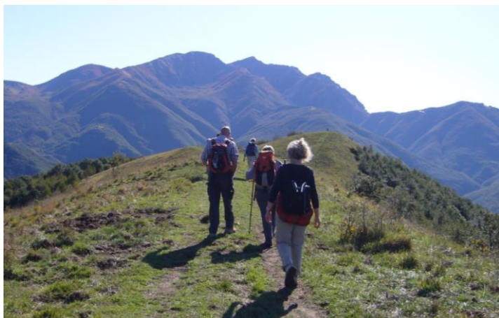
Pelgrims op weg naar San Gimignano

Ook in het augustijnenklooster in San Gimignano mogen we zeker in het seizoen van april tot oktober pelgrims onderdak verlenen. De stad ligt aan de beroemde via Francigena, een oeroude bedevaartroute van Noord-Italië naar Rome. Op die weg voelt men zich opgenomen in een sfeer van zoekende, biddende, open en ontvankelijke mensen, die tijden geleden hetzelfde deden.