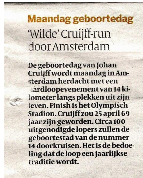
"De Volkskrant" van 23 april 2016

Ouderen onder ons kunnen zich nog goed de tijd herinneren waarin gelovigen op bedevaart gingen. Naar Kevelaer of Smakt of een der talloze andere plaatsen waar heiligen vereerd werden. In de tuin van Mariënhage werd jaarlijks op 10 september een processie voor de H. Nicolaas van Tolentijn gehouden. Ik dacht dat deze devoties allemaal tot het verleden behoorden. Totdat ik vanmorgen dit bericht in de Volkskrant las. Volgens mensen die er voor doorgeleerd hebben, heeft God Nederland inmiddels verlaten. Blijkbaar kunnen de heiligen nog rekenen op onze warme belangstelling.