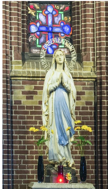
Twee van de drie beeltenissen van Maria die in onze kerk te vinden zijn. De derde afbeelding siert onze voorpagina