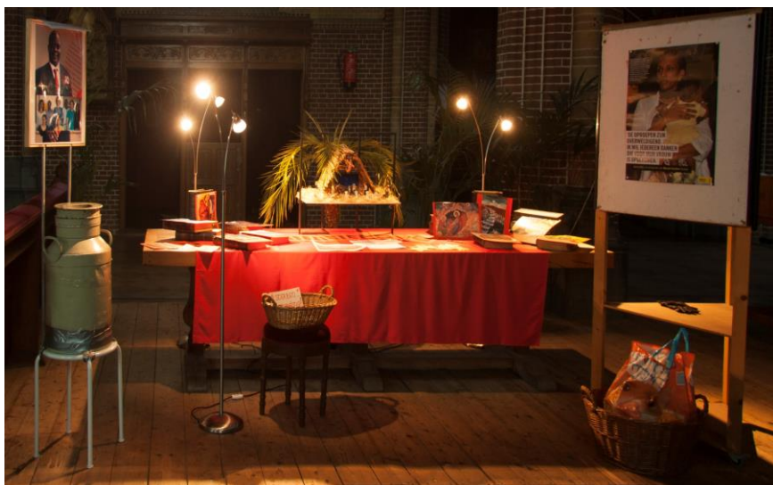
De opstelling voor de Advents-actie achter in onze kerk.

De adventsactie voor het Nijmeegs Instituut voor Missiologie heeft € 540 opgebracht. Dat is € 1000 minder dan de actie van vorig jaar opleverde die bestemd was voor de vluchtelingen in de Orangerie. Het is duidelijk dat dit doel onze emoties meer aansprak dan de inzameling voor een wetenschappelijk instituut. Desalniettemin zal het instituut blij zijn met onze gift!