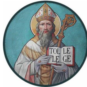
De twee hoofdrolspelers