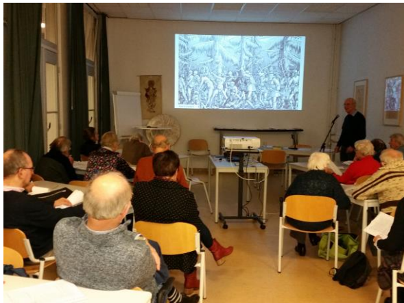
Sfeerbeeld van het Leerhuis in de Groene Zaal