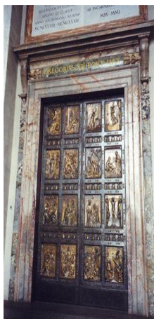
Heilige Deur Sint-Pieter, Rome

'Het zal een manier zijn om ons geweten wakker te schudden, dat vaak ingeslapen is ten aanzien van het drama van armoede, en om steeds meer door te dringen tot de kern van het Evangelie, waar de armen de bevoorrechten zijn van de goddelijke barmhartigheid. Jezus houdt ons deze werken van barmhartigheid voor, opdat wij kunnen begrijpen of wij wel of niet leven als zijn leerlingen'.