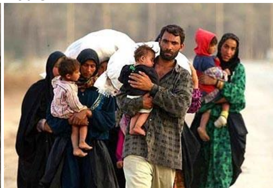
Vluchtelingen uit Syrië in 2015