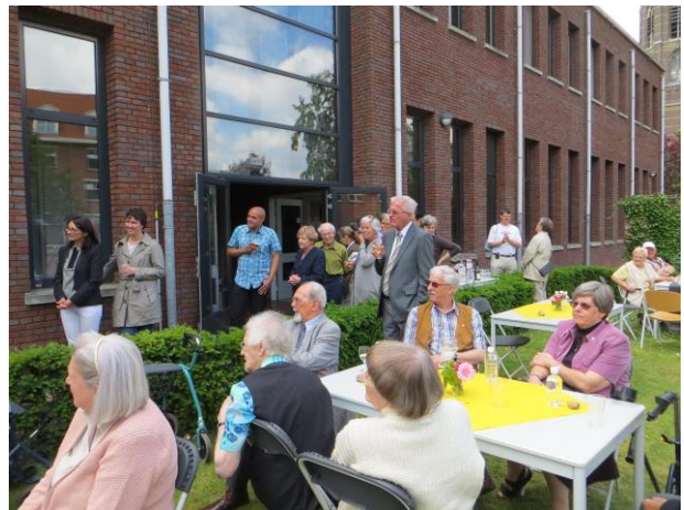
Enkele sfeerbeelden van de Open Kloosterdag.