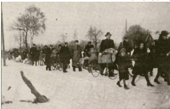
Vluchtelingen uit Melick in 1945