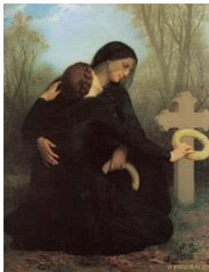
"Allerzielen" (William Adolphe Bouguereau, 1859)

Hoewel van huis uit katholiek, heeft de kerk voor velen, om verschillende redenen, afgedaan. Dat wil niet zeggen dat bij een ingrijpende gebeurtenis zoals bij de dood van een dierbare, er geen behoefte zou zijn aan spiritualiteit bij de uitvaart. De seculiere vormgeving van een uitvaartbureau wordt als te profaan gevoeld, de religieuze vorm echter als te kerkelijk. Maar er is ook een tussenvorm mogelijk. In tal van voorbeelden zal de inleider laten zien hoe hij samen met nabestaanden zoekt naar taal en teken, klank en kleur waardoor de religieuze dimensie bij een uitvaart op een nieuwe manier tot uitdrukking wordt gebracht.