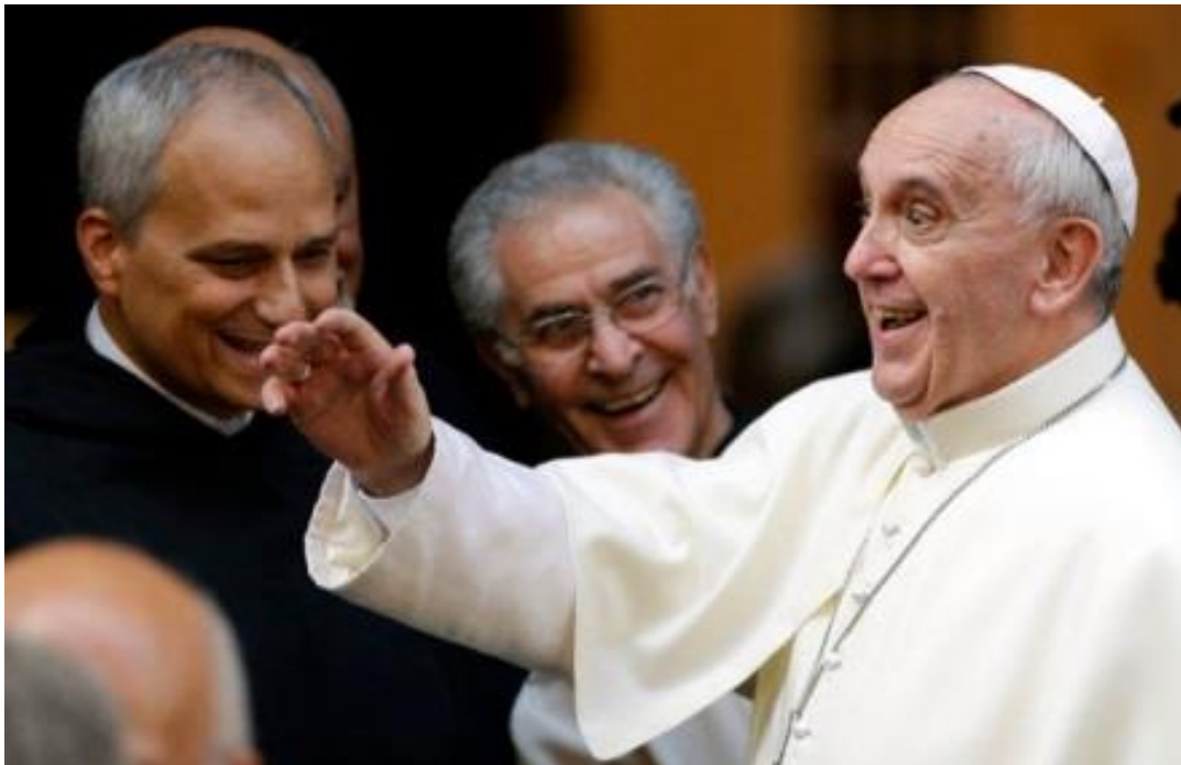
Paus Frans begroet het Generaal Kapittel. Links de aftredende prior-generaal Robert Prevost.