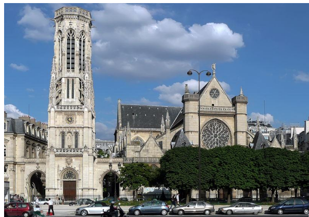
Sant Germain l'Auxerrois

Frankrijk had in het verleden een rijke augustijnse traditie. Op het hoogtepunt waren er meer dan vijftig conventen. Door de Franse revolutie en door de antiklerikale wetgeving was onze orde op een bepaald moment geheel uit Frankrijk verdreven. Na de Tweede Wereldoorlog, toen de Nederlandse