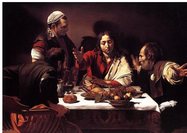
Avondmaal te Emmaüs van Caravaggio

Augustinus benadrukt in al zijn preken over de eucharistie dat niet alleen het geheiligde Brood en de gezegende Wijn lichaam en bloed van Christus zijn, maar ook de gelovigen die aan de eucharistie deelnemen. Bekend is Augustinus' aansporing (preek 272): 'Wees wat jullie zien en ontvang wat jullie zijn, lichaam van Christus!' De overtuiging dat gelovigen Lichaam van Christus zijn, keert in alle preken terug: 'Neem en eet het lichaam van Christus: zelf bent u ook al ledematen van Christus geworden in het lichaam van Christus. Drink wat u hebt gekost om niet te denken dat u maar weinig waard bent' (preek 228B,3) Die gedachte alleen al – een bisschop die zijn gelovigen heel veel waard vindt- is een kostbare aansporing tot én een belangrijke herinnering aan het communiceren onder twee gedaanten. Lichaam van Christus zijn is bij Augustinus iets dynamisch: zoals brood en wijn in ons veranderen wanneer we die eten en drinken, zo veranderen wij ook in het lichaam van Christus wanneer we gehoorzaam en vol eerbied leven (preek 228B,3).