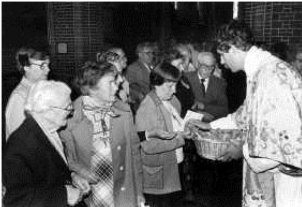
Het uitdelen van de Nicolaasbroodjes in onze kerk in 1981.

Als bronnen voor dit artikel is gebruik gemaakt van het boekje "De Augustijnen- of Paterskerk te Eindhoven. Een Rondgang" (Eindhoven 1987) en de webpagina's "Wikipedia", "RKK" en "Meertensinstituut".