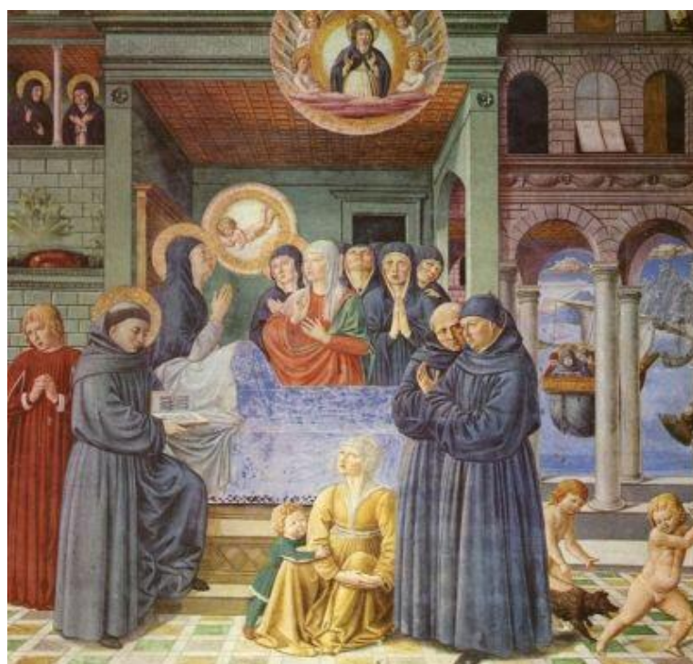
De dood van Monica

Benozzo Gozzoli leefde van 1420 tot 1497. Hij was een beroemd renaissanceschilder. U kunt meer over hem vinden op de website www.augustijnsinstituut.nl onder Augustinus' Leven en dan doorklikken naar Iconografie