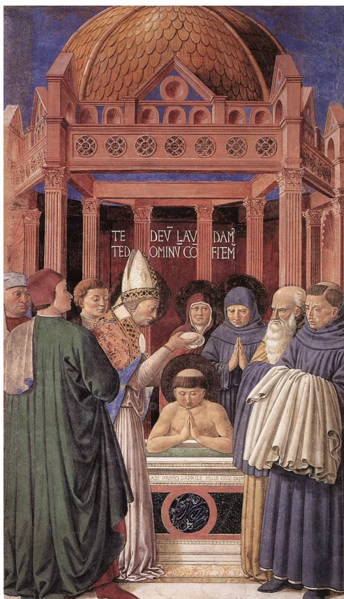
Doop door Ambrosius

Van de 14 e tot de 16 e eeuw is de kerk verrijkt met belangrijke kunstwerken. In het koorgedeelte achter het altaar is een cyclus van fresco's te bewonderen met episoden uit het leven van Augustinus, de patroon van de kerk. Deze fresco's, geschilderd door Benozzo Gozzoli en zijn leerlingen, zijn wereldberoemd en elke bezoeker van de kerk wordt er door getroffen. In zeventien muurschilderingen ziet men de voornaamste episoden uit het leven van Sint Augustinus. Door oorlogen, rampen en verwoestingen zijn sommige helaas onherstelbaar beschadigd. Prachtig ziet men bijvoorbeeld de eerste schooldag van Augustinus, het contact met zijn moeder Monica, zijn reis naar Italië, zijn doopsel dat wordt toegediend door Ambrosius, Augustinus als docent en de schenking van zijn regel aan zijn volgelingen.