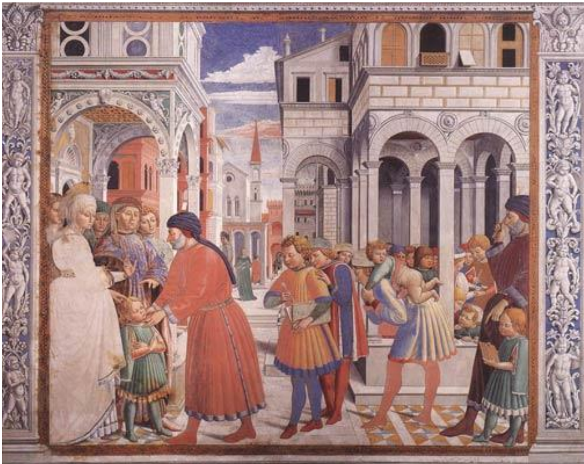
De eerste schooldag van Augustinus

De eerste groep augustijnen vestigden zich in San Gimignano in het jaar 1272. In het jaar 1280 verleende de plaatselijke bisschop toestemming aan de augustijnen om bij hun klooster ook een kerk te bouwen. Op 31 maart 1298 werd deze kerk geconsacreerd.