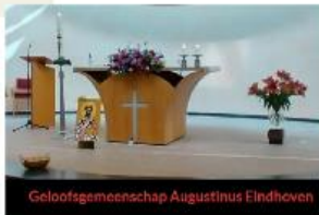
Geloofsgemeenschap Augustinus Eindhoven