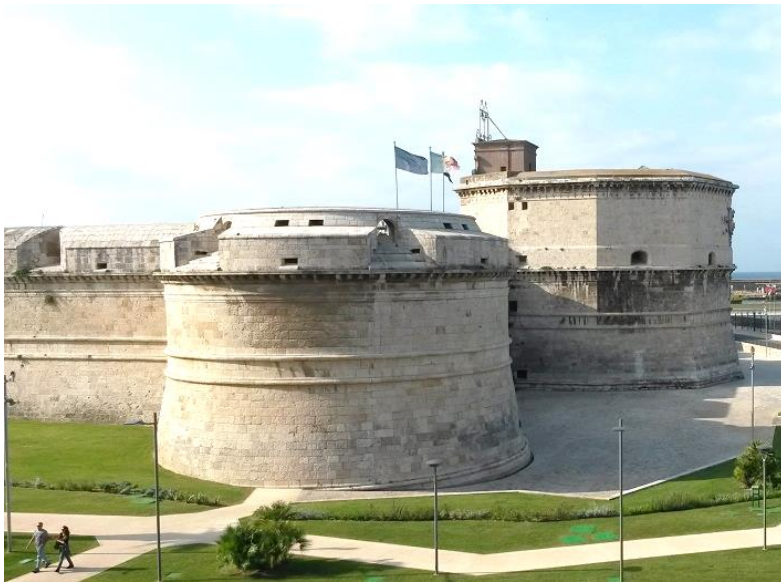
Forte Michelangelo in Civitavecchia, circa 70 km ten noordwesten van Rome

gevraagd wordt of hij aanvaardt en, zo ja, onder welke naam hij wil regeren. Dat lag nu wat moeilijk. Het was winter en dan is de Middellandse Zee wat minder die Méditerranée waar Toon Hermans over zong. Het kardinaalscollege stuurde een eerste delegatie naar Spanje, maar deze haalde het niet. Ondertussen vernam Adrianus op 22 januari informeel (en op 25 januari uit iets beter welingelichte bron) dat hij paus was. Echt formeel werd hij pas op 9 februari op de hoogte gebracht, toen de officiële delegatie uit Rome eindelijk in Spanje aankwam. Adrianus legde onmiddellijk zijn Spaanse waardigheden neer, aanvaardde (blijkbaar met enige aarzeling) en koos zijn eigen naam. Adrianus van Utrecht werd Adrianus VI.