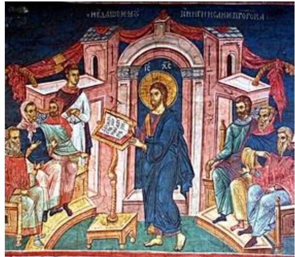
Jezus in de synagoge

Paulus geeft aan dat het in het leven gaat om geloof, hoop en liefde. Waarbij hij de liefde het belangrijkste noemt.