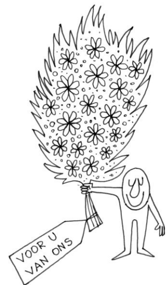
Getekend door Ton Smits (met dank aan mevrouw L. Smits-Zoetmulder).

In het gesprek zie ik meestal wat ik "de toegevoegde waarde" noem: sommige mensen hebben een enorme behoefte aan een luisterend oor, iemand die op de kamer ook even gaat zitten en de tijd neemt