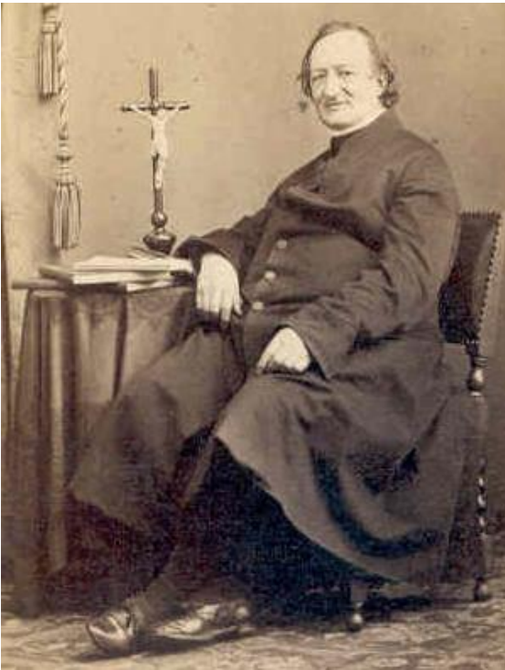
Pater de Kruif op latere leeftijd