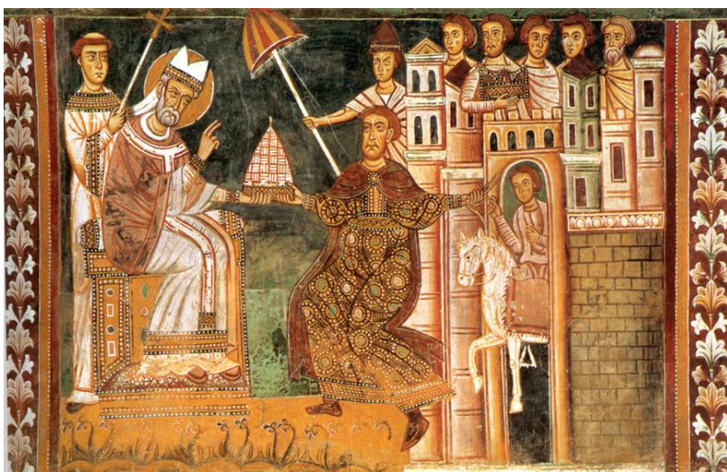
Keizer Constantijn schenkt paus Silvester de tiara.