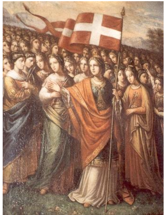
De H. Ursula met haar elf duizend maagden

Toch bezit de kerk van Sint-Oedenrode relieken van Oda, maar toen die in de jaren 1990 wetenschappelijk onderzocht werden, bleek het grootste wonder dat ooit met de H. Oda verbonden kan worden: de relieken van deze 8ste-eeuwse heilige stamden uit de 2de of 3de eeuw! Hoe dit te verklaren? Relatief eenvoudig. Toen men relieken nodig had, heeft men er aangeschaft, uit Keulen, de oude Romeinse provinciehoofdstad van Germania Inferior en zetel van de aartsbisschop waaronder het bisdom Luik viel (en Eindhoven was net als Leuven tot 1559 onderdeel van het bisdom Luik). In Keulen bevindt zich, iets ten noordwesten van het grote station de kerk van de H. Ursula met haar 11.000 maagden, een kerk gebouwd middenin een Romeins grafveld. Geen wonder dat deze kerk vol relieken is, want die zaten daar in de grond als in Drenthe de keien of flinten. Een van deze anonieme Romein(s)en is dus in Sint-Oedenrode beland als Oda. Wellicht te goeder trouw. Een heilige is een heilige en of het nu Oda is of een ander maakt eigenlijk niet zoveel uit.