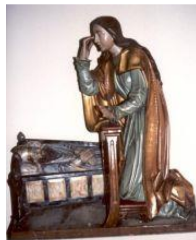
De H. Oda van St. Oedenrode

Oda was een Schotse (of Ierse) prinses. Dat was destijds hetzelfde. Zij was blind geboren. Niets kon haar helpen en met een blinde prinses kun je niets beginnen, je kunt zo iemand niet uithuwelijken en daar dienen prinsessen uiteindelijk toe. Dit is niet seksistisch, misschien wel schokkend, maar de historische waarheid. Oda trok op bedevaart naar het Europese continent. Ze bezocht Rome, de Monte Gargano in Apulië waar een fameus heiligdom van de H. Michael was. Uiteindelijk kwam ze in Luik, bij het graf van de relatief recent vermoorde bisschop Lambertus. Niet zeggen tegen de Luikenaars, maar hun stad, hun grote trots, is gebouwd rond een moordplaats, a crime scene . Lambertus hielp en Oda zag. Ze keerde terug naar haar vader. En deze dacht 'Ha!, Uithuwelijken dus!' Dat was evenwel niet naar de zin van Oda die na haar