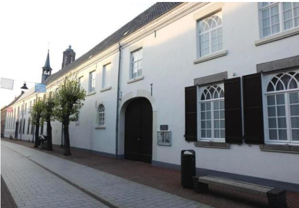
Ingang van het gastenhuus van de zusters Birgittinessen in Weert

Drie weken na het afscheid te Argentinië, zo vertelde Maxima, bezocht zij hier in Nederland een ziekenhuis waar mensen met terminale kanker knokken voor hun bestaan. Maxima benoemde gevoelig het contrast tussen deze patiënten en degenen, die net zoals haar zus, het bestaan niet meer aankonden. Terecht -maar tamelijk kort- werd de hulplijn voor levensmoeden 113-OnLine op het tv-scherm vermeld.