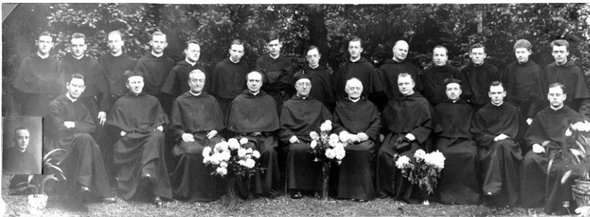
Volle kloosters in de jaren dertig van de vorige eeuw. Paters en broeders augustijnen gefotografeerd in de tuin van klooster Mariënhage in Eindhoven.

De schrijver heeft voor dit werk een enorme hoeveelheid cijfermateriaal verzameld, bewerkt en geanalyseerd. Gezien de omvang, diepgang en de degelijkheid van dit proefschrift roept de schrijver bij mij een groot respect op. Hij heeft al dit werk gedaan zonder gebruik te hebben kunnen maken van een computer.