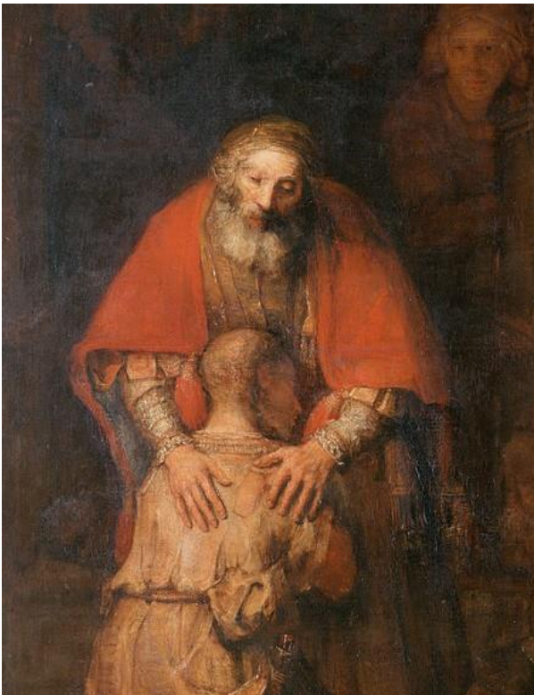
Detail uit 'Terugkeer van de verloren zoon' van Rembrandt in de Hermitage.

Als de radeloze zieke vrouw op zoek is naar hulp, raakt ze Jezus aan. Ook Jezus raakt op zijn beurt het ingeslapen dochtertje van Jairus aan. Hun gebaar gaat gepaard met een appèl -aan Jezus en van Hem aan de Vader- dat onuitgesproken wordt gedaan. En dat toch kan worden gehoord, maar wel 'met andere oren'. Rembrandt heeft het fenomeen schitterend vastgelegd in zijn schilderij.