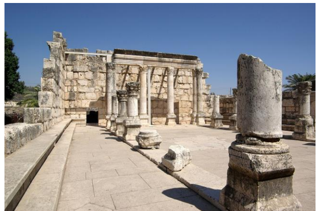
Het huidige Kafarnaüm

J ezus en zijn leerlingen trokken naar Kafarnaüm, en op de eerstvolgende sabbat ging Hij naar de synagoge, waar Hij als leraar optrad. De mensen waren buiten zichzelf van verbazing over zijn leer, want Hij onderrichtte hen niet zoals de schriftgeleerden, maar als iemand die gezag bezit. Er bevond zich in hun synagoge juist een man die in de macht was van een onreine geest en luid begon te schreeuwen. 'Jezus van Nazaret, wat hebt Gij met ons te maken? Ge zijt gekomen om ons in het verderf te storten. Ik weet, wie Gij zijt: de heilige Gods.' Jezus voegde hem dreigend toe: 'Zwijg stil en ga uit hem weg.' De onreine geest schudde hem heen en weer, gaf nog een luide schreeuw en ging uit hem weg. Allen stonden zó verbaasd, dat ze onder elkaar vroegen: 'Wat betekent dat toch? Een nieuwe leer met gezag! Hij geeft bevel aan de onreine geesten en ze gehoorzamen Hem.' Snel verspreidde zijn faam zich naar alle kanten over heel de streek van Galilea.