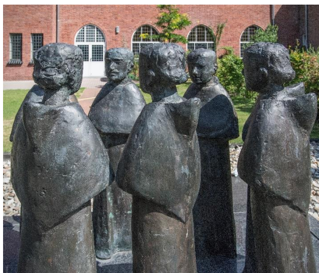
Grafmonument Mariënhage. (Beeldhouwer: Thomas Rodr osa)

Vraag: Iedereen wordt geroepen. Wie riep je afgelopen week en met welke opdracht?