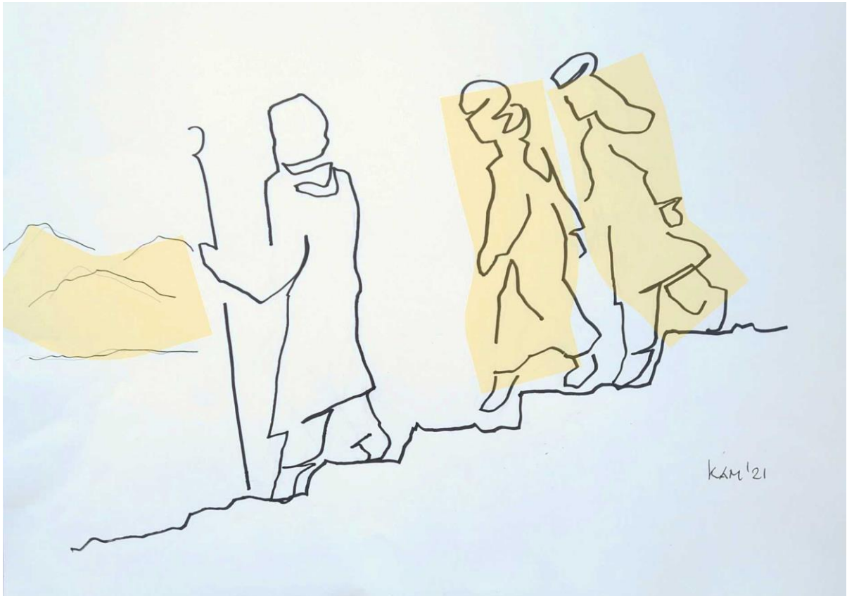
Rabbi, waar houdt Gij u op? (Tekening: Anita van der Kam)