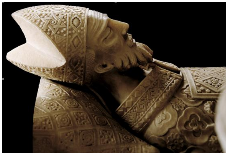
Afbeelding van het graf van Augustinus in Pavia

https://www.augustinus.nl/Allerheiligen-en-allerzielen