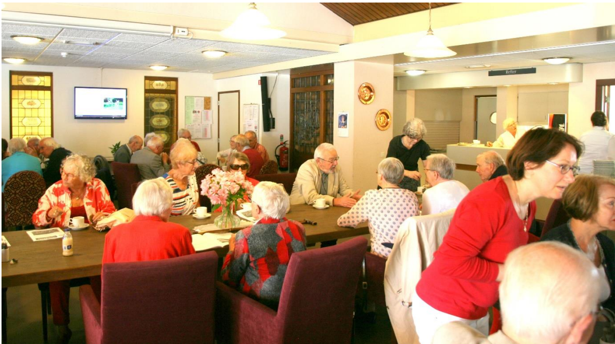
De goeie ouwe tijd

Twee dingen springen er voor mij uit. Dat ik geen contact kan hebben met onze oudste zoon in Epe omdat die op minder dan 160 kilometer afstand nu net zo onbereikbaar is als onze jongste zoon die op ruim 1600 kilometer afstand in Helsinki woont. Waarbij komt dat in het laatste geval de kleinkinderen, die we niet meer hebben kunnen vasthouden sinds Sinterklaas in december, nog geruime tijd onbereikbaar blijven. Want Finland is alleen per vliegtuig bereikbaar en dat lijkt me thans het allerlaatste vervoermiddel om in te stappen. Het andere wat ik node mis is de zondagsviering op Glorieux, ook vanwege het achtste sacrament -ik citeer een van onze voorgangers- zijnde de koffie na afloop. Daar kreeg ik elke week het gemeenschapsgevoel, omdat je mee kon leven met het lief en leed van anderen.