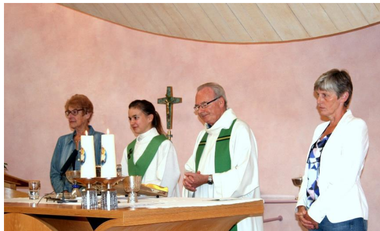
Evolutie in de liturgie