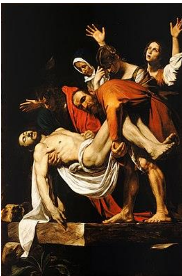
Graflegging, geschilderd door Caravaggio

Deze gebeurtenis raakte de eerste christenen op een bijzondere manier en ook voor ons is het interessant, want wat we hier zien, is dat Jezus tot het einde met menselijkheid omringd blijft. Deze menselijkheid die hem werd ontzegd, die weg gelaten werd, zodat hij veroordeeld kon worden door Pilatus en op het kruis genageld werd. En toch blijven een paar mensen over, met onder andere Josef van Arimatea en bewijzen Jezus de laatste eer. De vrouwen zullen na de sabbat terugkomen om de balseming af te maken.