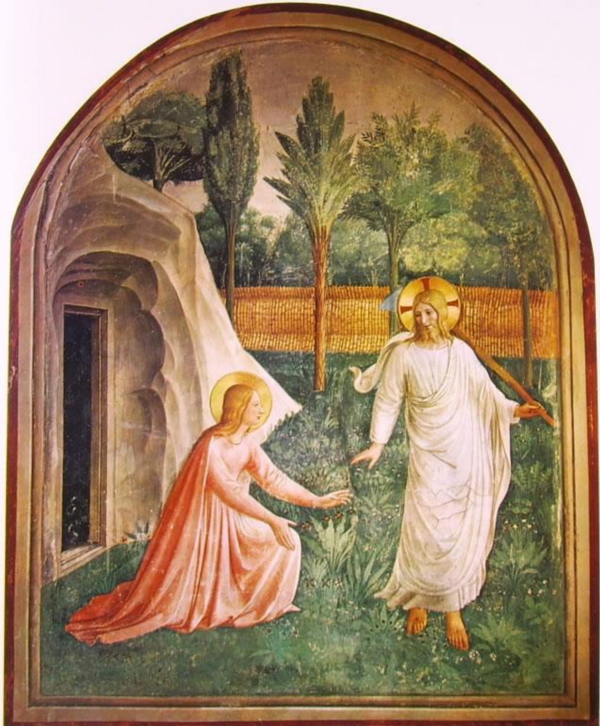
Fra Angelico (1395-1455)