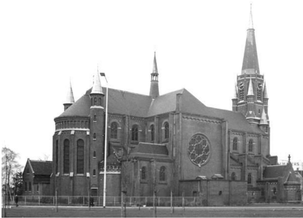
Kerk van de H. Antonius op Fellenoord

De Paterskerk gaat dicht. Dat is geen nieuws meer. Het is ook niet de eerste kerk die gaat sluiten, noch de laatste, denk ik. Lang geleden viel de kerk waar ik gedoopt ben, de Antonius Fellenoord, al ten prooi aan de toenmalige Eindhovense sloopwoede. Op dat moment was ik overigens al elders parochiaan, in de H. Hart Ploegstraat, waar ik net mijn eerste Latijnse zinnetje geleerd had als misdienaar; "ad deum qui laetificat juventutem meam." (...ik zal opgaan naar het altaar van de God die mijn jeugd heeft verblijd). Prettig overigens in retrospectief te kunnen constateren dat dat zinnetje in mijn geval klopt. Dit werd de kerk vanuit waar ik mijn ouders heb begraven, maar ook die waar mijn vrouw en ik assisteerden bij kindernevendiensten en onze beide zoons hun eerste communie hebben gedaan. Toen ook deze kerk enkele jaren geleden aan de eredienst werd onttrokken -pijnlijk en extra lastig voor minder mobiele parochianen -moesten we op zoek naar een nieuwe plek.