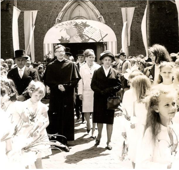
Eerste mis in Nuenen