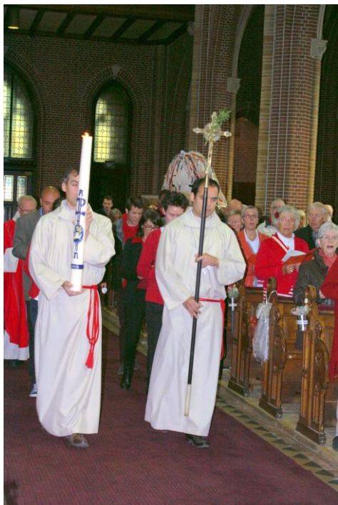
Foto-impressie van de Pinksterviering