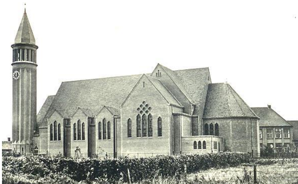
Kerk van het H. Hart in de Ploegstraat

laatste mis pas om kwart over twaalf 's middags begon, als nergens anders in de stad meer kerkklokken luidden. En heel speciaal was voor mij die ene kerstnacht toen na afloop iedereen buiten zalig kerstfeest kreeg toegewenst door paters die in hun zwarte habijt, terwijl de sneeuwvlokken het plein wit maakten, de kou trotseerden en zo, bij mij althans, het Charles Dickens kerstgevoel opriepen.