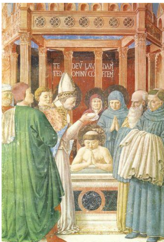
De doop van Augustinus door bisschop Ambrosius van Benozzo Gozzoli