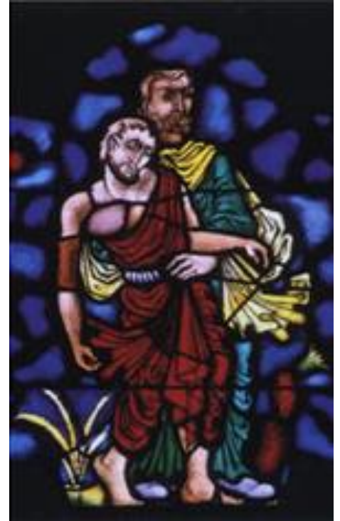
De barmhartige Samaritaan

Op de derde zondag van de advent na de mis kunnen vrijwilligers Uw vragen daar beantwoorden.